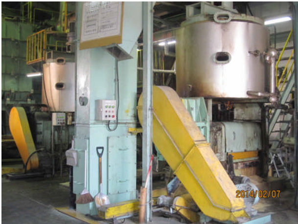
↑ エキスペラー搾油装置

「エキスペラー搾油装置による食品副産物の再生油脂・飼料化事業」 やまこ産業株式会社