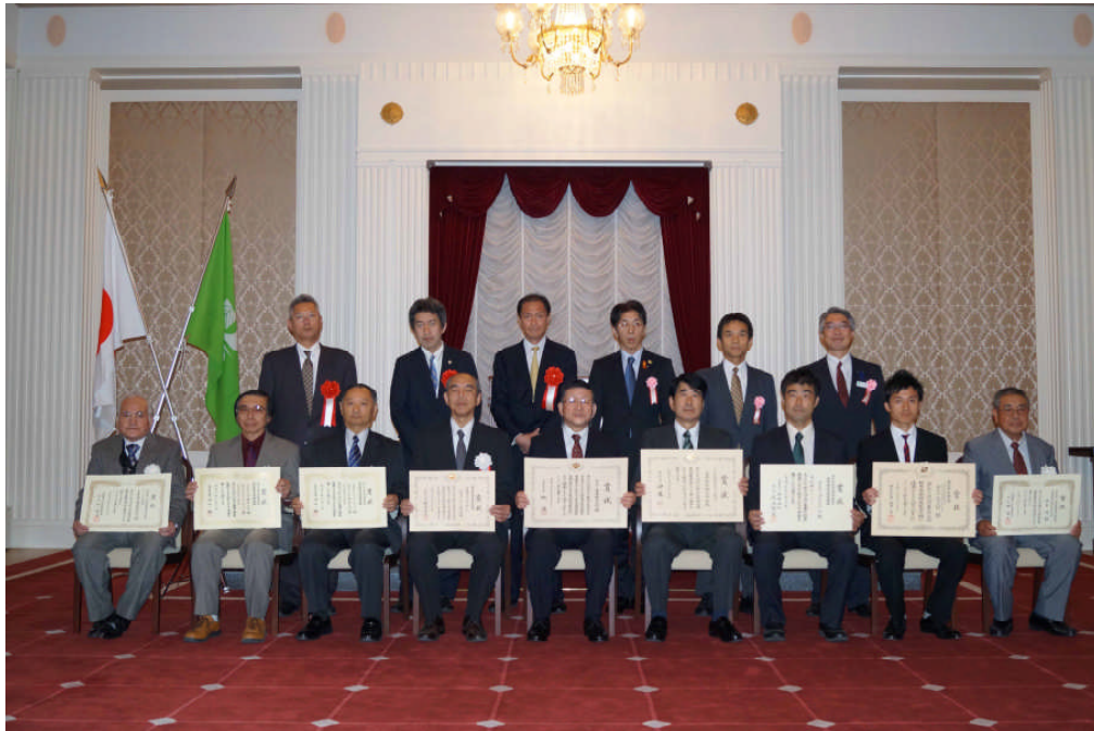
「第65回栃木県発明展覧会授賞式」 栃木県庁 昭和館にて 2015/11/25(水)