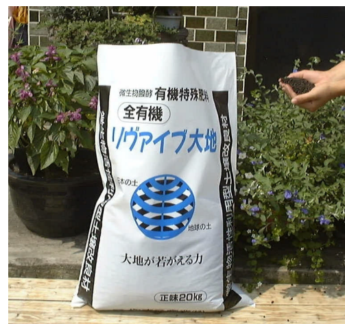
↑ 土壤改良材「リヴァイブ大地」

やまこ産業株式会社 TEL: 0282-55-1311 FAX: 0282-54-1212 URL: http://yamaco.biz/ E-mail: hsogura@yamaco.co.jp (小倉 久緒)